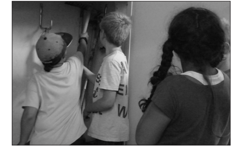
Rangement des outils